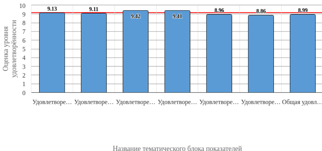
Рисунок 3.1 - Средняя оценка удовлетворенности (по всем тематическим блокам показателей)

Средняя оценка удовлетворенности респондентов по блоку вопросов «Удовлетворенность организацией обучения» равна 9.13, что является показателем высокого уровня удовлетворенности (75-100%).